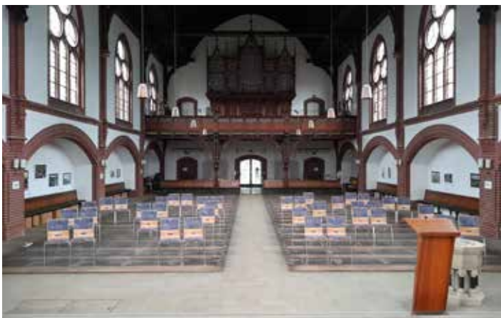
Stühle stehen bereit für den Gottesdienst