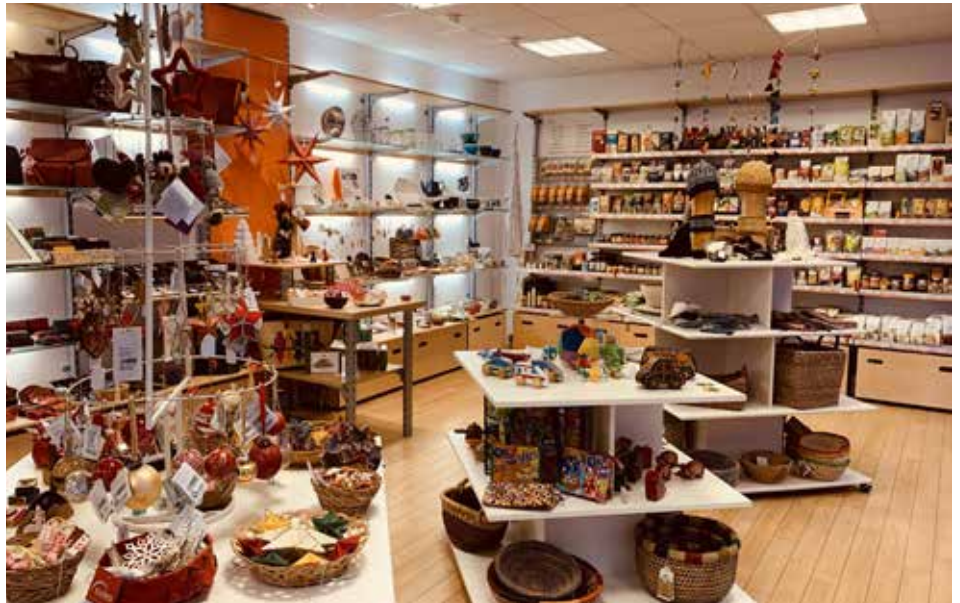
Eine große weihnachtliche Auswahl im Weltladen in der Hölertwiete

Im Folgenden drei Beispiele für Lieblingsgeschenke , bei denen die vollständige Wertschöpfung tatsächlich im Herkunftsland erfolgt: