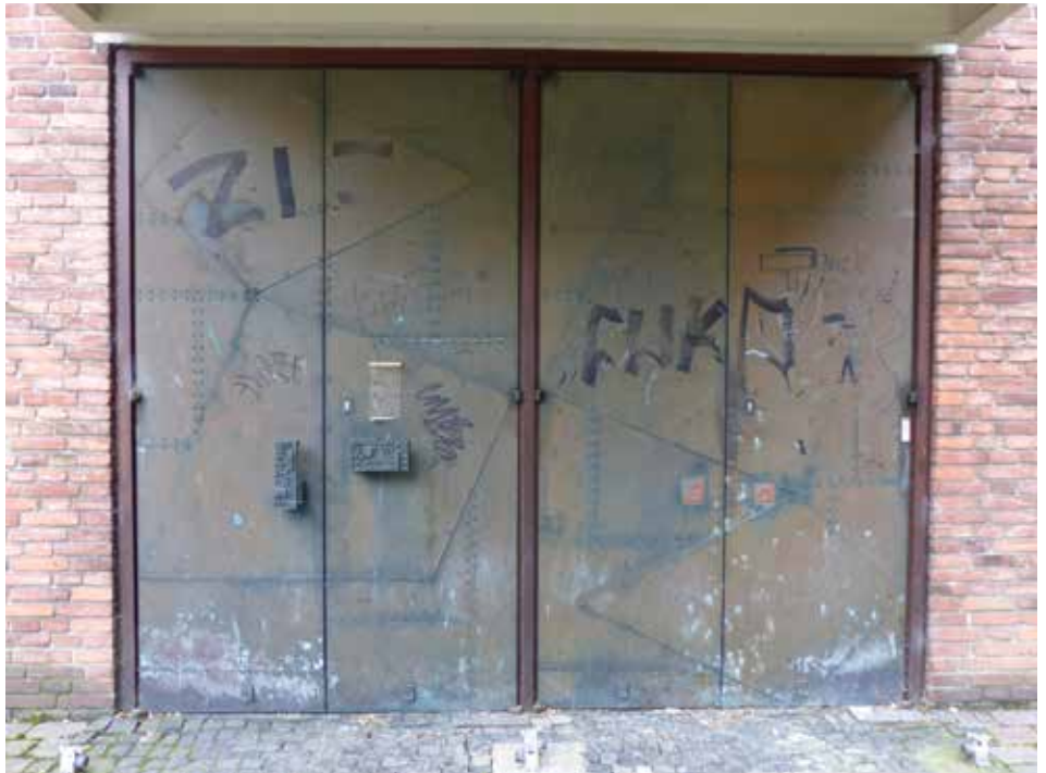
Haupteingang der Dreifaltigkeitskirche Harburg (Neue Straße 44)