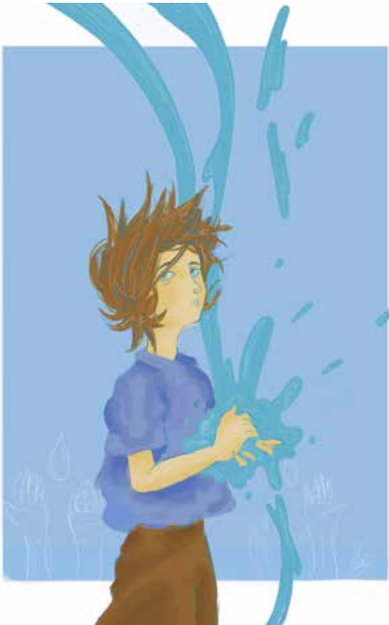
von Lea Marwinski