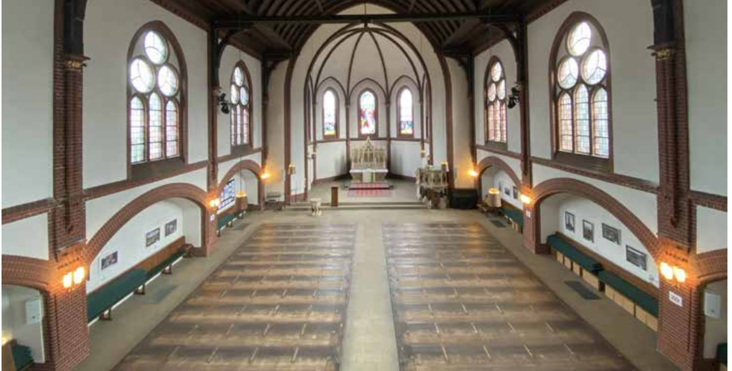
St. Pauluskirche ohne Bänke: eine große freie Fläche, die vielfältig genutzt werden kann

Schon länger spukte die Idee in den Köpfen: Was könnte man alles in der St. Pauluskirche machen, wenn die Bänke aus dem Weg wären? Inzwischen hat der Kirchengemeinderat dazu getagt und das Experiment ist gestartet. Mit viel Handarbeit und großer Sorgfalt sind die Bänke aus der St. Pauluskirche ausgebaut, inventarisiert und sicher eingelagert worden. (s. Bild auf S. 32) Die ersten Reaktionen, die wir aus der Gemeinde erhalten haben, reichen in großer Bandbreite von „O, wie schrecklich!“ bis „O, wie toll!“.