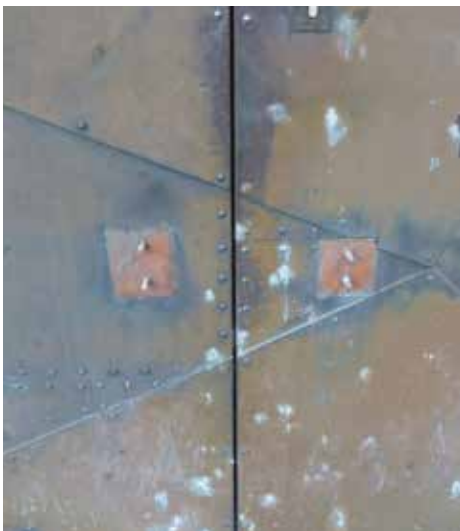
Kirchentüren ohne Griffe

Übrigens ist dieser Drang, sich in Mauern oder Türen einzuschreiben, keine moderne Unart und auch nicht beschränkt auf die jüngere Generation. Römer, die ersten Christen, französische Soldaten und Touristen haben an den antiken pharaonischen Gemäuern in Ägypten auch ihre Zeichen hinterlassen. Die sehen manchmal nur etwas gekonnter aus. Und noch etwas ist ähnlich wie in Ägypten. Es wird gerne mal etwas verbotenerweise mitgenommen. Die rechten Kirchentüren haben ihre „Klinken“ nicht mehr. Vor ein paar Wochen waren sie nicht mehr da, abmontiert und gestohlen. Warum die Diebe nur zwei statt vier haben mitgehen lassen? An den linken Türen sind sie anscheinend diebstahlsicherer angebracht. Sie konnten nicht einfach