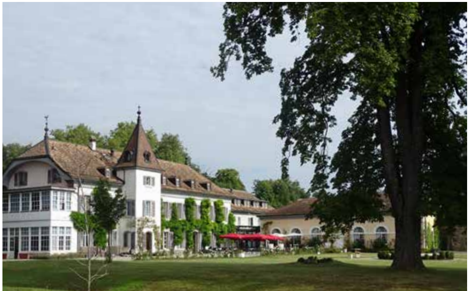
Das Ökumenische Institut in Bossey über dem Genfer See

Einander zuzuhören, voneinander zu lernen, die Sprache der anderen zu verstehen: darum geht es in Bossey. Aber auch darum, Kontakte zu knüpfen und Freundschaften zu schließen. Oder: ein living letter der eigenen Tradition, des eigenen Kontextes zu sein, für andere, und somit am großen Ziel der Ökumene, der Einheit der Christenheit in der Vielfalt, mitzuwirken. Die fünf Monate in Bossey verändern die Menschen. Man ist am Ende nicht mehr dieselbe Person wie zuvor. Das Weltbild hat sich geändert, die innere Einstellung gegenüber den anderen Kulturen, Traditionen und Theologien.