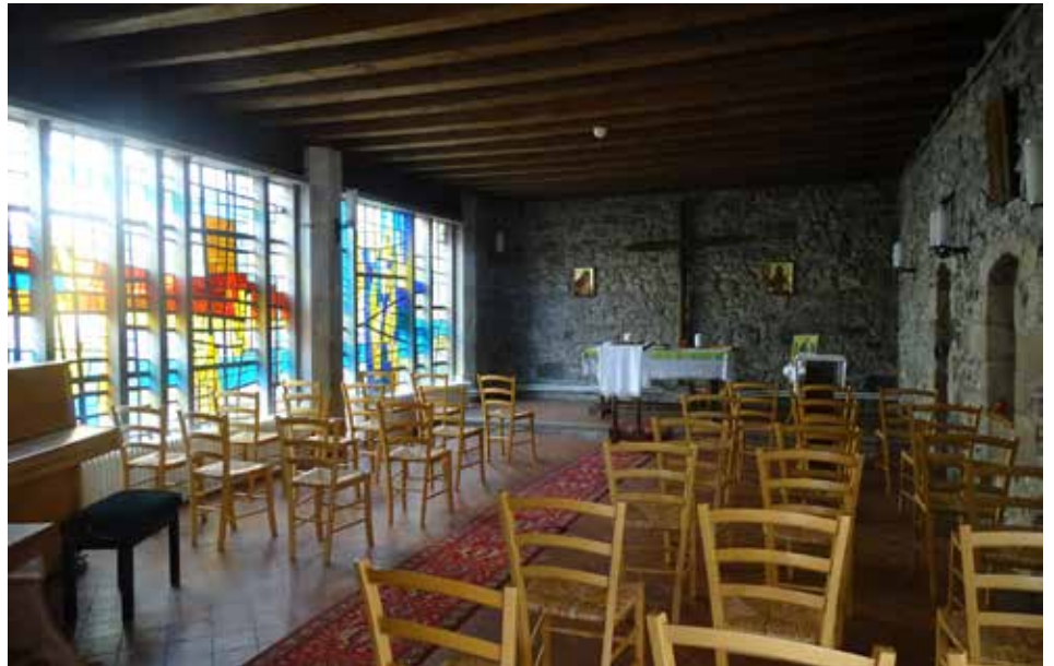
In der Kapelle von Bossey

Wir sind 33 Studierende aus 5 Kontinenten, 17 Ländern und 25 Kirchen, und studieren und leben zusammen in Bossey Ökumene. Die großen Herausforderungen dabei sind weniger unsere unterschiedlichen Vorstellungen davon,