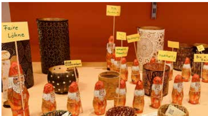
Die Schoko-Nikoläuse zeigen Haltung